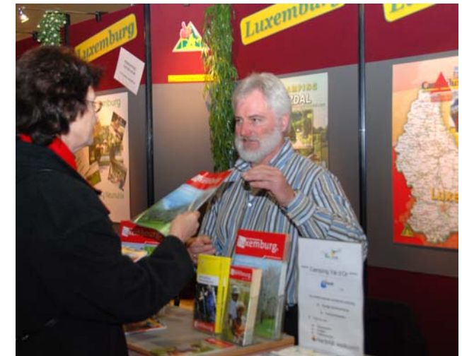
RAN-Stand Caravana Leeuwarden

Allgemeine Informationsbroschüre über unser Dienstangebot der Wintersaison.